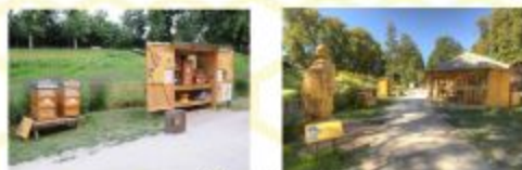
Imkerstandort auf der LGS Bad Schwalbach

2016 erwarb der Verein ein Grundstück und ist damit beschäftigt einen Lehrbienenstand einzurichten. Die Landesgartenschau 2018, an der sich der Verein mit einem Informationsstand beteiligte, wurde zu einem Erfolg für Bad Schwalbach.